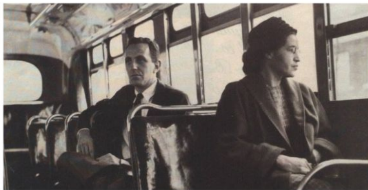
Una foto di Rosa Parks sull'autobus per Cleveland Avenue