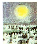
Il sole ritrovato