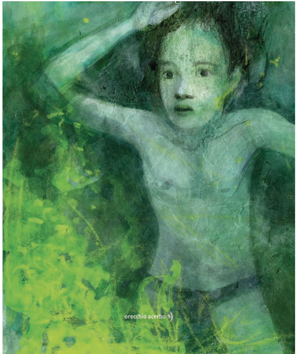
orecchio acerbo &gt;

→ / A PROJECT BY / D.A.T.E. / DATE-SNEAKERS.COM /